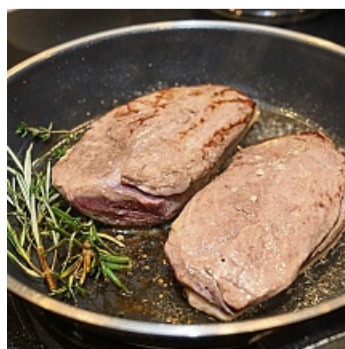
Die Hautseite der Entenbrüste kurz anbraten.

Öl erwärmen. Rosmarin und Thymian dazugeben. Die Entenbrust erst auf der Bauchseite mit wenig Farbe anbraten. Danach die Entenbrust wenden und auf der Hautseite weiterbraten, bis die Haut kross ist. Überschüssiges Bratfett zum Blaukraut geben. Backofen auf ca. 150° C erhitzen. Entenbrust mit der Hautseite nach oben auf ein Gitter setzen und 15 Minuten im Backofen garen. Backofen ausschalten, die Entenbrust 5 Minuten ruhen lassen. 7. Krosse Kohlsprossen: Etwas Öl in einer Pfanne erhitzen, die Kohlsprossen in der Pfanne kross braten, mit Salz und Pfeffer würzen. 8. Feldsalat mit Kürbiskernöl marinieren. 9. Anrichten: Blaukraut auf die Teller geben. Entenbrust in Scheiben schneiden und auf das Blaukraut legen. Orangenfilets mit dem Saft dazwischen geben, mit den Granatapfelkernen bestreuen. Mit Feldsalat garnieren. Kohlsprossen darüber geben.