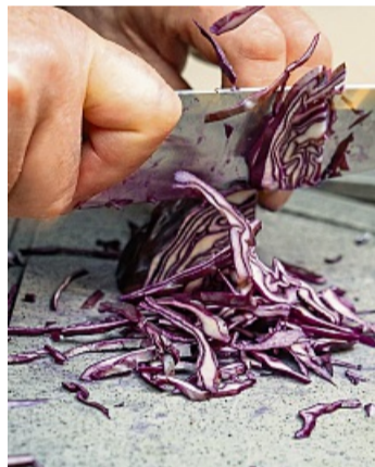
Von Hand wird das Blaukraut geschnitten.