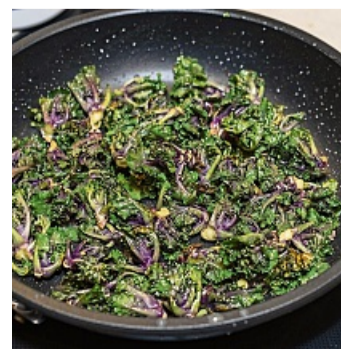
Kross gebraten werden die Kohlsprossen.