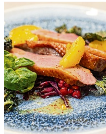
Das Auge isst mit: Ente mal anders.