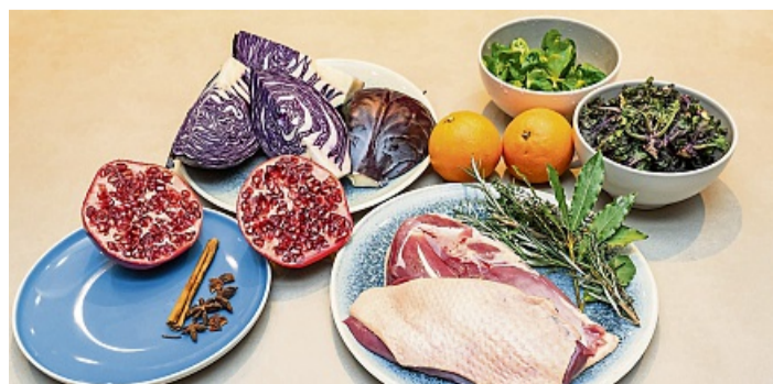
Das für ein Anblick: Die Zutaten für die schnelle Ente mit Blaukrautsalat zur Adventszeit.