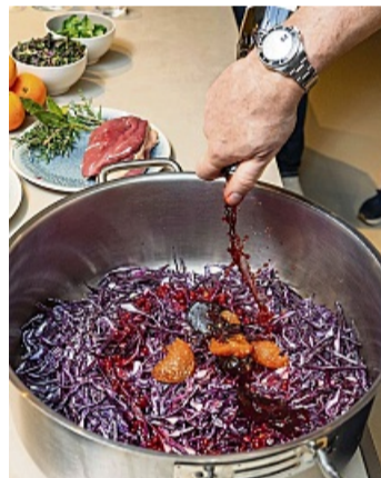
Blaukraut als lauwarmer Salat.