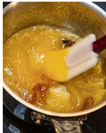
Orangen mit Karamell und Gewürzen kochen.