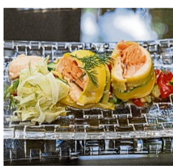
So schmeckt der Sommer: Roulade von der Forelle.

3. Für die Roulade beide Zucchini waschen, trocken reiben und die Endstücke abschneiden. Mit einem Hobel die Zucchini längs in dünne Scheiben hobeln. Zucchini in kochendem Salzwasser kurz blanchieren und sofort in Eiswasser legen, danach auf einem Küchentuch trocken legen. Eine Arbeitsfläche leicht befeuchten und eine Frischhaltefolie darauflegen. Die Zucchinischeiben abwechselnd auf der Folie überlappend auslegen. Die Fischfarce dünn auf den Zucchinischeiben verteilen und das Filet vom Alpenlachs darauflegen, mithilfe der Folie fest einrollen und an den Enden zusammendrehen. Roulade zusätzlich in Alufolie wickeln und an den Enden fest zusammendrehen. Mit