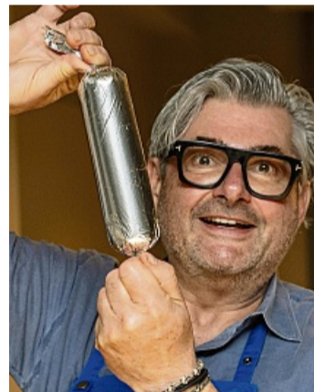
Fisch in Alufolie gewickelt. Die Rolle wird erwärmt.