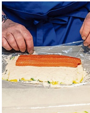
Farce auf Zucchinistreifen streichen, mit Filet belegen.