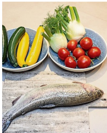
Tolle Kombination: Forelle und Sommergemüse.