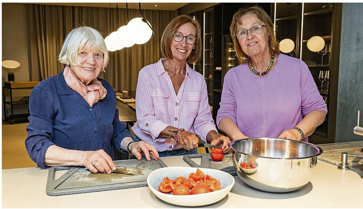
Die Damen der Leser-Kochschule bereiten einen Tomatensalat der Extraklasse zu – ohne Haut und ohne Kerne.