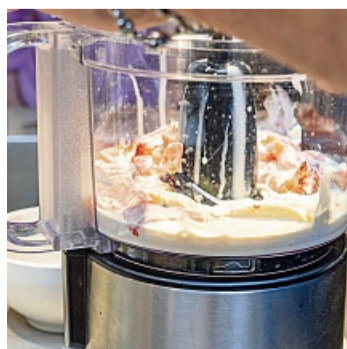
Eiskalt müssen die Zutaten für die Farce sein.

Dazu passt: fein gehobelter Fenchel-Salat.