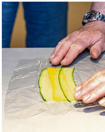
Erst gelb, dann grün: So schichtet man den Mantel.